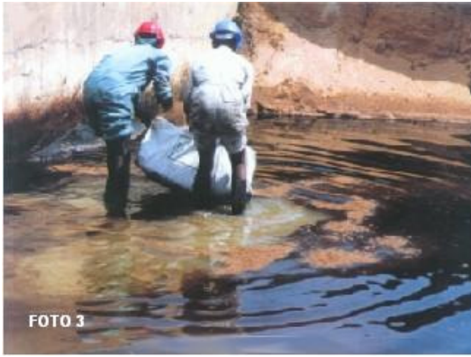
Foto 3: Biomatrix Gold es extendido sobre todo el área cubriendo completamente la zona líquida (agua, aceite, disolventes, etc.)

Biomatrix Gold inmediatamente comienza a encapsular los Hidrocarburos y demás contaminantes.