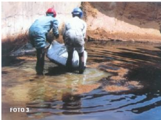
Foto 3: Biomatrix Gold es extendido sobre todo el área cubriendo completamente la zona líquida (agua, aceite, disolventes, etc.)

Biomatrix Gold inmediatamente comienza a encapsular los Hidrocarburos y demás contaminantes.