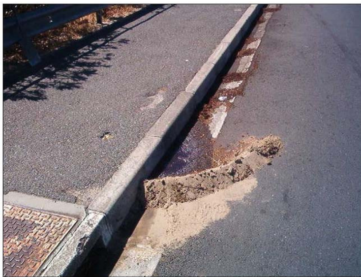
Frenando el vertido en pendiente.